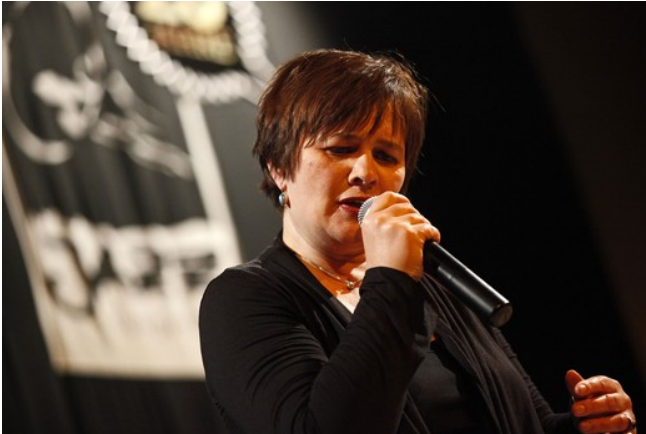
Vera Kaa und Band.